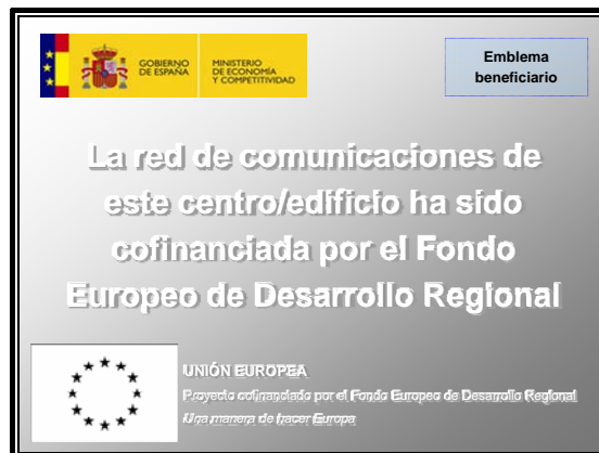
Figura 4: Ejemplo de placa explicativa en red de comunicación

La siguiente figura muestra un ejemplo de placa explicativa: