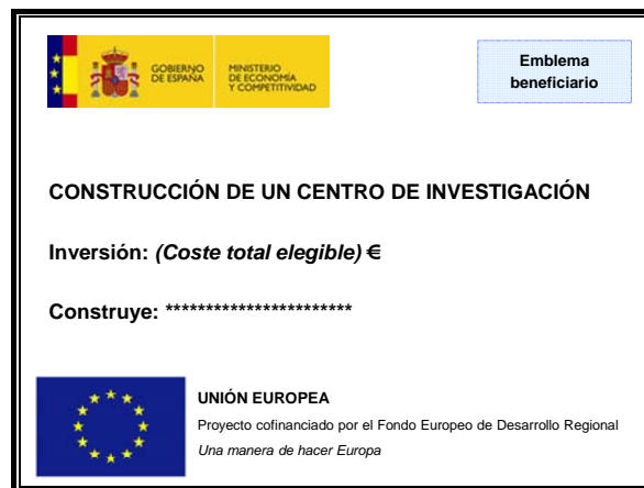
Figura 1: Ejemplo de cartel en obra de construcción

La siguiente figura muestra un ejemplo de cartel: