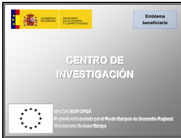
Figura 2: Ejemplo de placa explicativa en centros construidos

La siguiente figura muestra un ejemplo de placa explicativa: